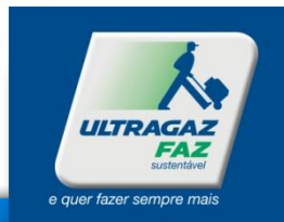
Faixa utilizada na Frota da Ultragaz