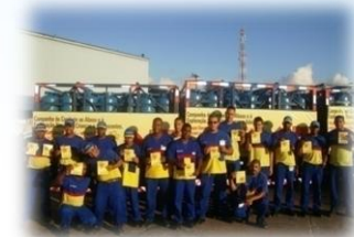
Imagem da campanha na filial