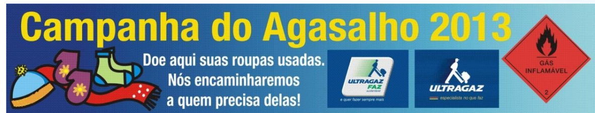
Faixa utilizada na Base da Ultragaz